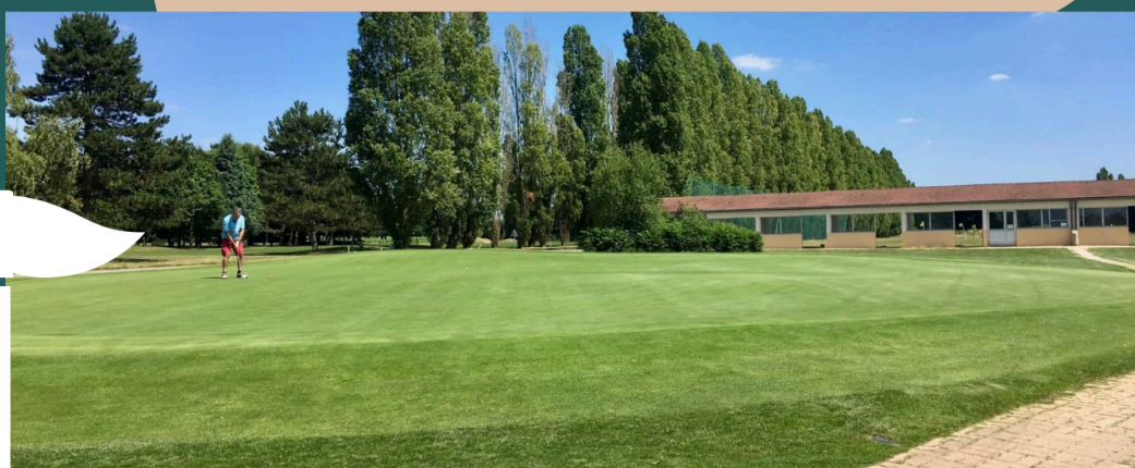
Golf de Villacoublay, Base 107, 78129 Villacoublay